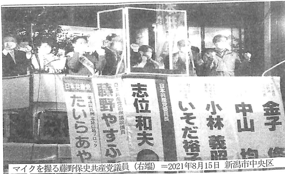
マイクを握る藤野保史共産党議員 (右端) =2021年8月15日 新潟市中央区