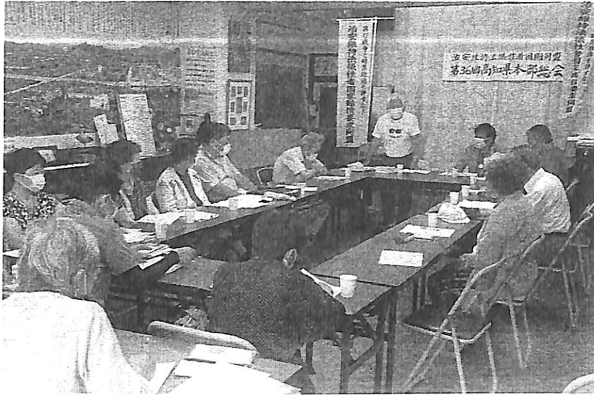
36回 高知県本部総会