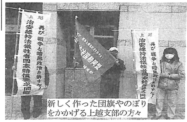
新潟市中央区のメーデー 集会の壇上のような様子