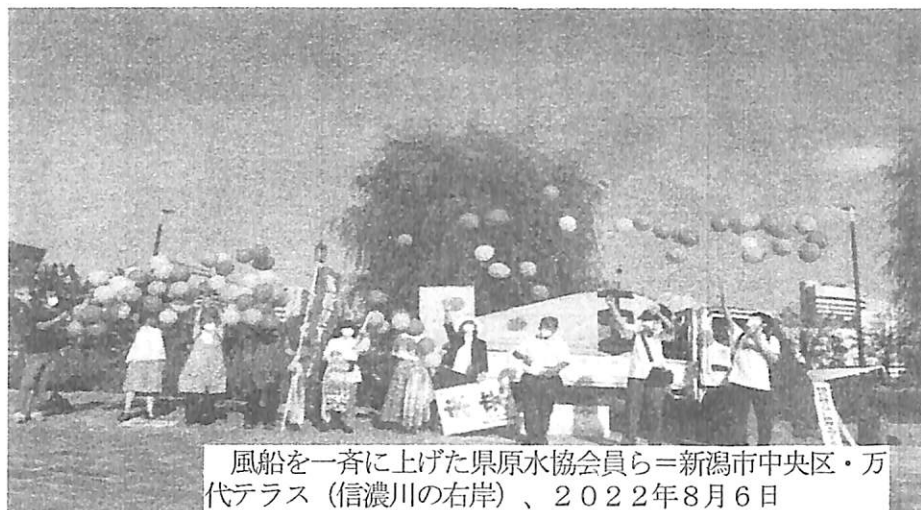
風船を一斉に上げた県原水協会員ら＝新潟市中央区・万代テラス（信濃川の右岸）、2022年8月6日