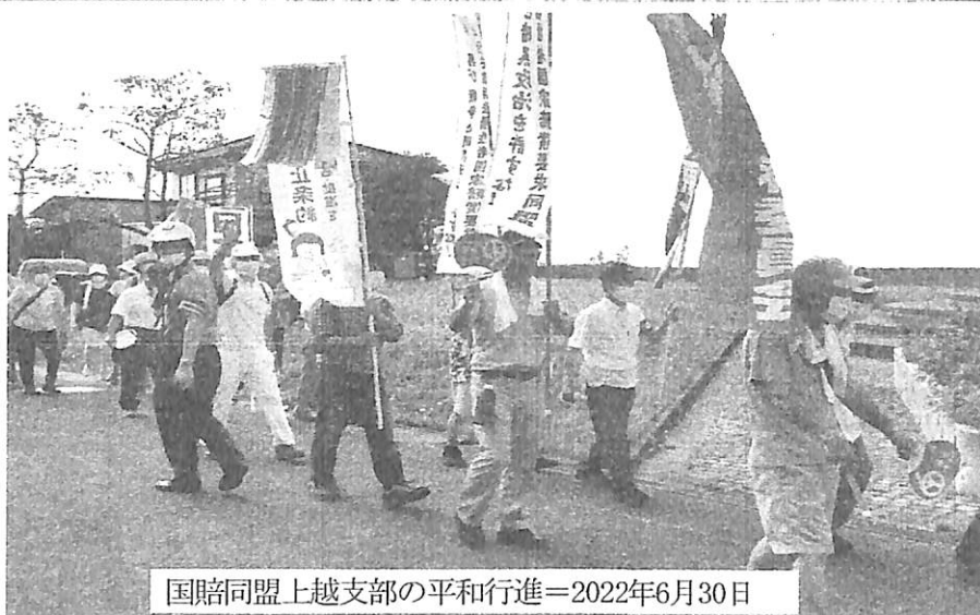
国賠同盟上越支部の平和行進＝2022年6月30日