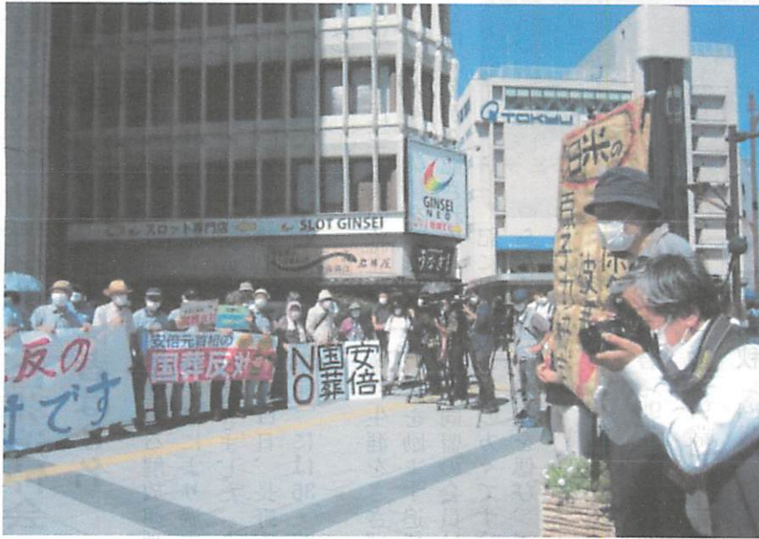
《9月4日、長野駅前での9条に会など6団体と3野党の共同街頭宣伝》