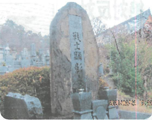
《長野市城山の無名戦士の顕彰碑》

社会の発展と平和・民主主義の確立のため尊い生涯をささげ、志半ばで斃られた方々の業績を顕彰し、ご遺族を励ます追悼会です。第38回分は39名が合祀されましたが、国賠同盟の会員は左記に掲げた8名の方々です。あらためてその業績を偲び、ご冥福を心からお祈りいたします。