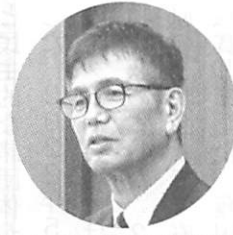
日本共産党 衆議院議員 宮本 たけし

「この悪法は東大、京大、阪大、東北大、名古屋大と岐阜大を統合した東海機構という5大国立大学には「運営方針会議」と