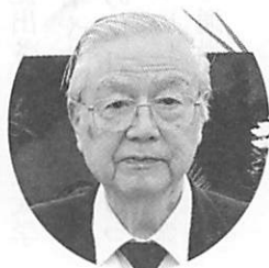
関西勤労者教育協会副会長 労働者教育協会理事