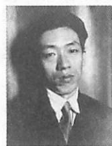
小林多喜二(1903~1933) プロレタリア文学作家 代表作「蟹工船」で当時の ブラック企業を暴露した。