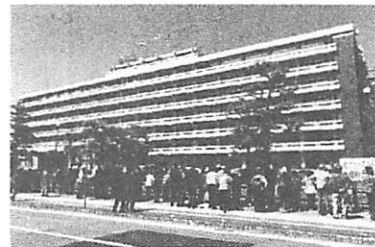
浜田知事に抗議の声をあげた特定指定港湾反対集会

岸田首相が訪米して四月十日に行われた日米首脳会談は、日米軍事同盟をさらに危険なものにする重大なものでした。日米共同声明は、この間岸田内閣が進めてきた「安保三文書」による大軍拡や、敵基地攻撃能力の保有、自衛隊統合作戦司令部の新設計画などを「日米の防衛関係をかつてないレベルにひきあげ、日米安全協力の新しい時代を切り開く」と評価。「過去三年間を経て日米同盟は前例のない高みに到達した」と絶賛しています。