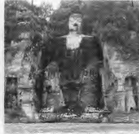
名山、名仏の樂山大佛(写真)。

今回の旅は「四川大地震」と「日本軍による無差別大爆撃」を知る旅です。訪問する成都、重慶とは中国中西部に位置し中国最大の四川盆地にあり、成都は四川省の省都、重慶は中国四大直轄市のひとつ（他、北京、天津、上海）。成都が日本人にとって馴染みの深い三國時代に活躍した劉備と諸葛孔明のゆかりの地、郊外には10月の四川盆地の最高気温は20℃〜最低15℃。四川は一年中で晴