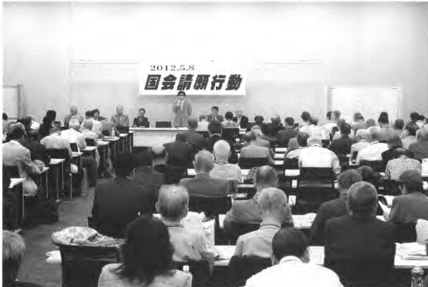
国会請願全体集会で挨拶する井上哲士参院議員(2012. 5. 8衆院第1議員会館)