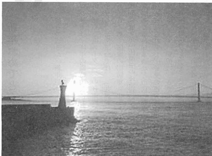
明石海峡の初日の出

〒113-0034 東京都 文京区湯島2-4-4 平和と労働センター・全労連会館 電話 03(5842)6461 FAX 03(5842)6462 E-mail chian@bz03.plala.or.jp 頒価 50円