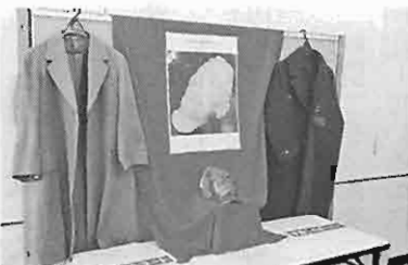
会場に展示された多喜二のデスクとコートなどの遺品