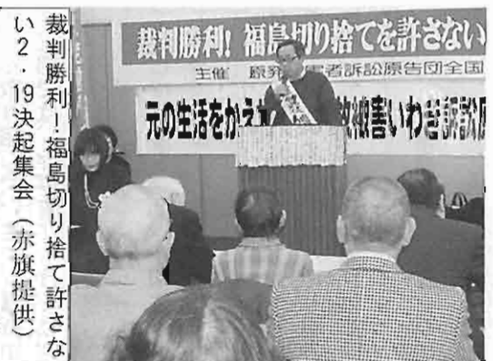
裁判勝利! 福島切り捨てを許さない 2・19決起集会

ても、帰還者が50%以下。同時に「復旧」加速化の美名のもと、政府・東電は待っていましたとばかり、避難解除帰還を煽っている。