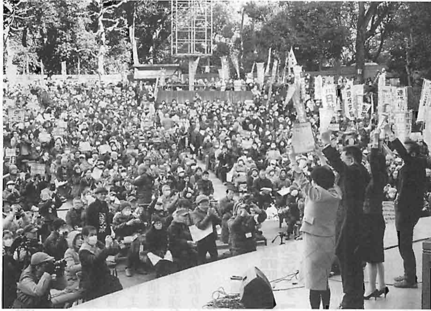
「格差・貧困ノー!!みんなが尊重される社会を!2・19集会」