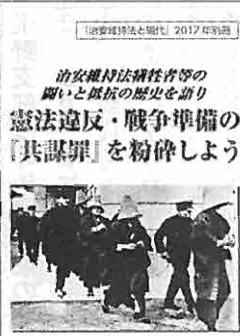
治安維持法犠牲者国家賠償請求同盟

維持法同盟の立場①「共謀罪」は形を変えた治安維持法②司法取引と盗聴、スパイによる挑発の危険③「共謀罪」は憲法改悪の幕開け狙う④国連越境組織犯罪防止条約の批准に必要はウソ。II治安維持法制定の背景と目的、III治安維持法の内容と