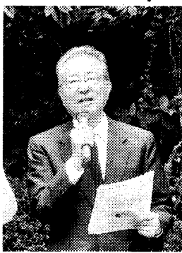
挨拶する小澤副会長