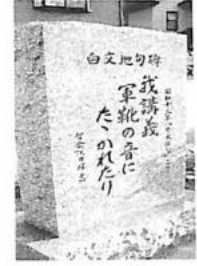
伴って変化すべきだという俳句運動

第3高等学校に入学し、学友に誘われ、俳句を詠みはじめ、句誌『ホトトギス』などに投句。その後、鳥取聯隊に入隊しますが1カ月で病氣除隊、京都帝大大学院に入学。29歳で『京大俳句』の創刊の中心メンバーとして新興俳句運動に力を注ぎます。俳句も社会の変化に伴って変化すべきだという俳句運動