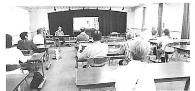
て記念講演。 「記念講演だけでも聞きたい」と県教職員組合の役員も参加、「上映運動実行委員会」を発足させるうえで有意義あ

沖縄県の「新型コロナウイルス緊急事態宣言」の最中、23人が参加しました。赤嶺政賢衆議院議員が国会報告（写真）、藤田廣登さんが「伊藤千代子の生涯とその時代」と題し